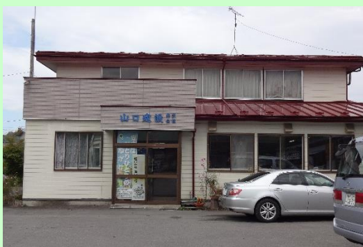
▲山口建設株式会社 本体外観

季節的な繁閑の差がある場合、繁忙期には週40時間を超える時間、閑散期には週40時間より短い時間の労働時間とし、1年を平均して週40時間以内の労働時間とすること