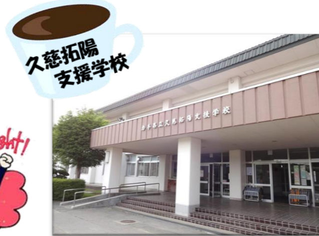
久慈拓陽支援学校

元気にやっていますか？社会人は「体力」と「気力」で勝負です。そして、何があっても先ず1年間くじけずにやり切ること。何事も1周、2周と繰り返しやっていかなければわからないままです。失敗を恐れず先輩を頼って遅く頑張ってください。期待しています！